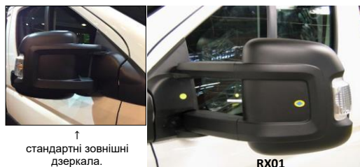
↑ стандартні зовнішні дзеркала.