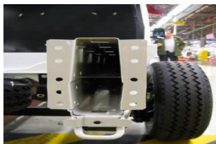
Подвійна рамна рейка "U"-типу.